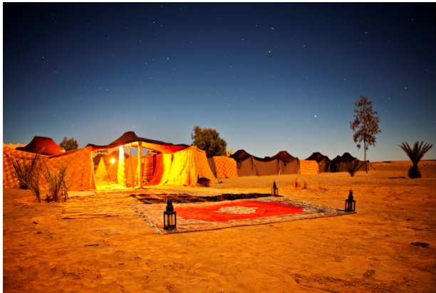
Biwak „Belle Etoile“ unter dem Sternenhimmel