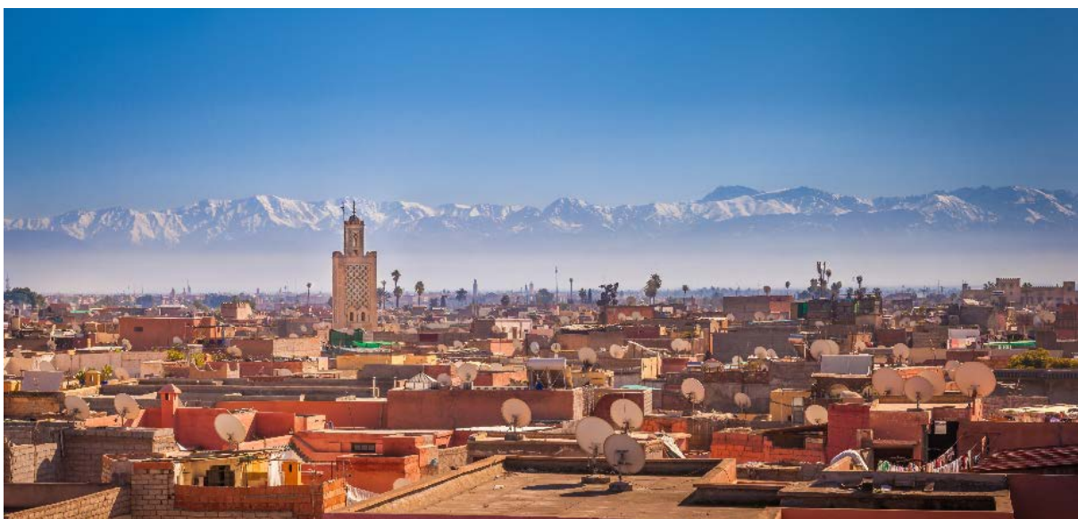
Marrakesch – faszinierend die Ausblicke über den Dächern mit der Koutoubia-Moschee

14.15 h Transfer zum Flughafen und Rückkehr via Lissabon (mit TAP) nach Zürich. Abflug 16.30 h, Landung in Zürich – Kloten 22.40 h.